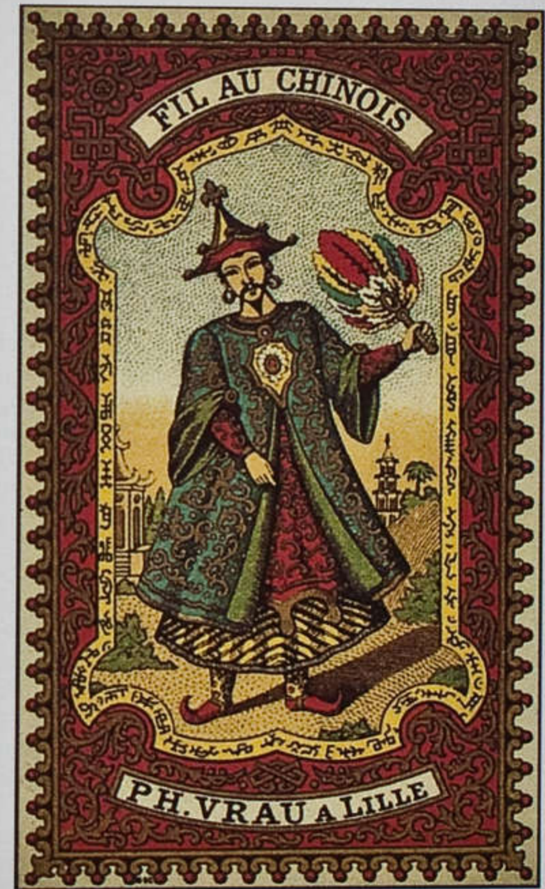
Étiquette "Fil au chinois"

En 1867, six cents personnes sont employées y compris les travailleurs à domicile ; ils sont mille en 1870. En 1891 à la suite de progrès de productivité le personnel est de cinq cent quarante personnes dont quatre cent dix femmes et parmi elles six religieuses. Celles-ci sont chargées de l'encadrement spirituel et moral. Elles sont présentes dans les ateliers, font les comptes de salaire mais ne s'occupent pas de la production supervisée par des contre-dames. Il existe une chapelle intégrée, des offices réguliers et de nombreuses initiatives à l'intention du personnel. À plus d'un siècle d'écart, l'esprit doit faire un effort de compréhension envers cette époque si différente de la nôtre pour